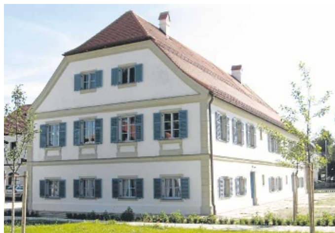
Gleich neben dem Rathaus steht das frisch sanierte Kulturhaus im Herzen Unterneukirchens.

Im Herbst 2013 wurde mit der aufwändigen Sanierung des Kulturhauses begonnen. Das 1812