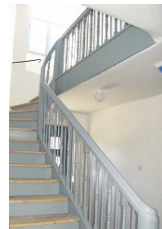
Die alten Treppen und Handläufe wurden erhalten.

Buch 55 - 84577 Tüßling - Tel. 08633 263 - Fax. 08633 7933 www.gratzl-schreinerei.de - mail@gratzl-schreinerei.de