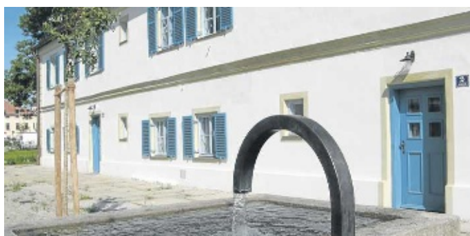
Vor dem Eingang plätschert ein Brunnen.