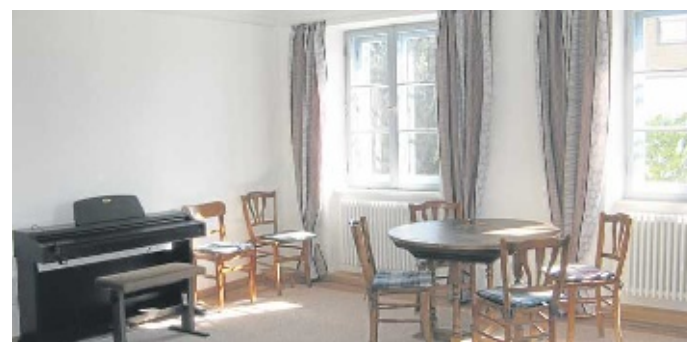
Die Musikschule und andere Vereine sind schon eingezogen.