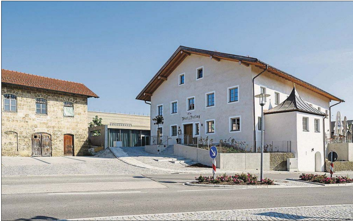
Der denkmalgeschützte und sanierte Gasthof zur Post in Tyrlaching.